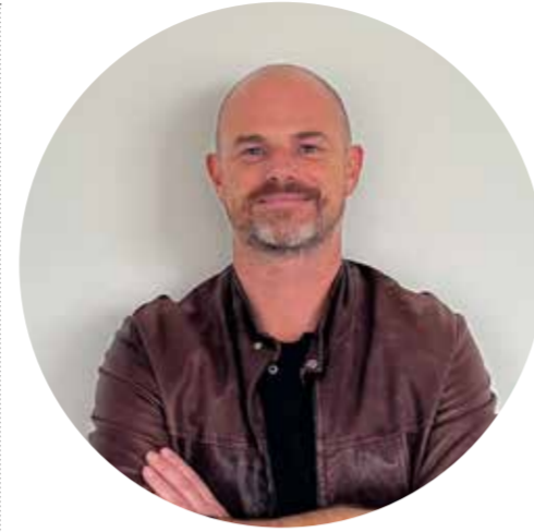
MASSIMO SANTAGIULIANA FACILITY MANAGEMENT