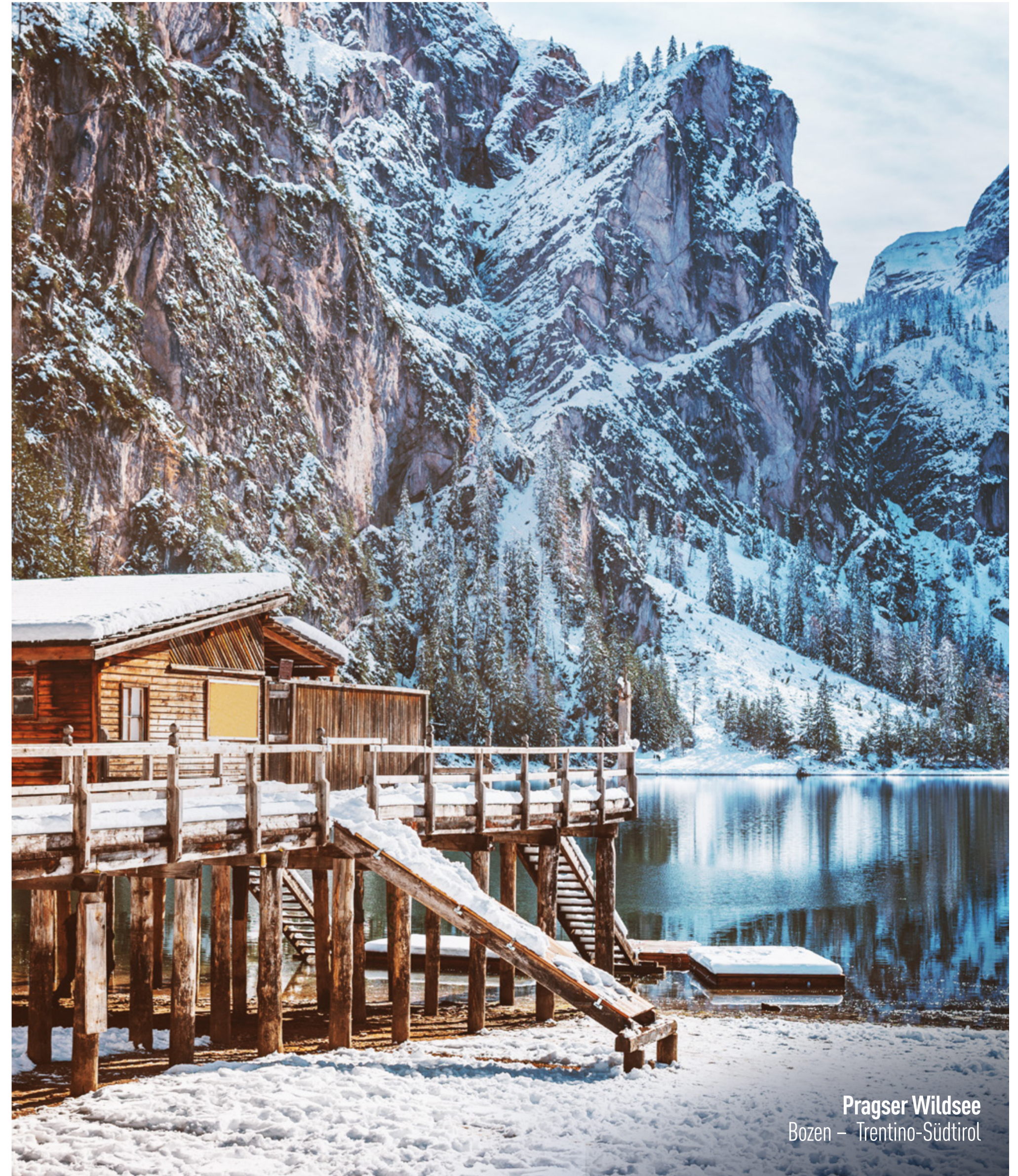
Pragser Wildsee Bozen – Trentino-Südtirol

Firmensitz: Galleria Firenze, 3/3A 36022 Cassola (VI) Italia taka.it